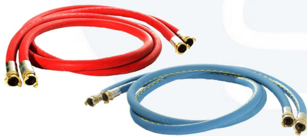
Raccordi con attacchi rapidi GEKA da 1"