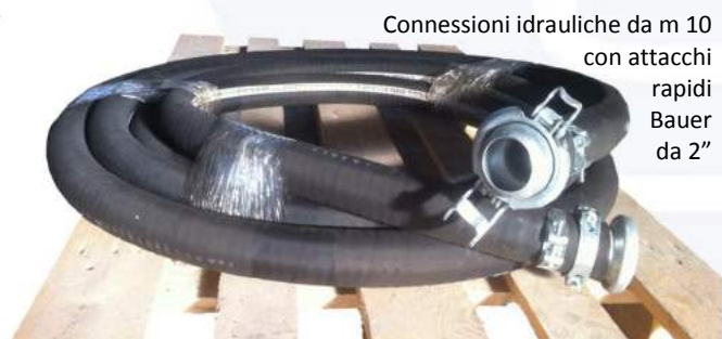
Conessioni idrauliche da m 10 con attacchi rapidi Bauer da 2"

*Se la macchina è collegata ad un differenziale, questo deve essere di tipo B