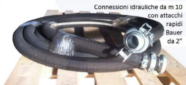
Conessioni idrauliche da m 10 con attacchi rapidi Bauer da 2"